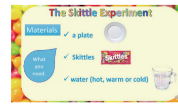
Amazing World - Skittle Experiment Find out how to do the Skittle Experiment!