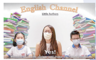
Special Programmes - Ebook Creator Learn how to make your own book on-line!