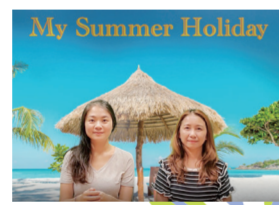
Show and Tell - My Summer Holiday Discover what your classmates did on their summer holiday!