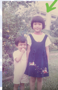
Now and Then - When they were young Watch and find out who this teacher is?